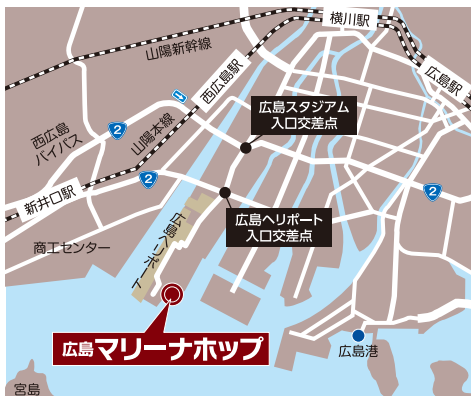
マリナーホップ内 イベントスペース 案内図